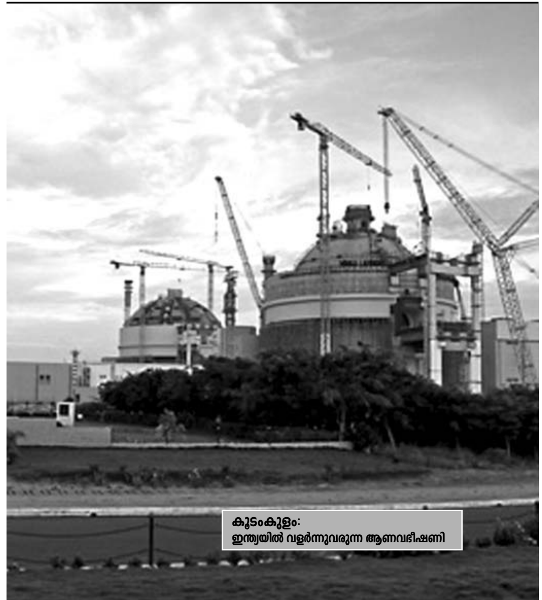
കൂടുംകൂട്ടം: ഇന്ത്യയിൽ വളർന്നുവരുന്ന ആണവഭീഷണി